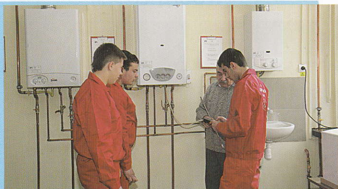
ПГТЕ Хенри Форд е най-голямото професионално техническо училище в България

Завършилите средно специално образование придобиват професионални компетентности за: