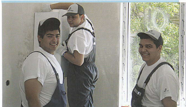
Принципи на дуалното обучение